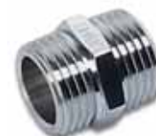
MS-Cr Nypel podwójny, GZ x GZ