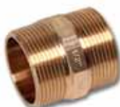
MS Nypel podwójny, GZ x GZ