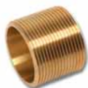
MS Nypel prosty, GZ